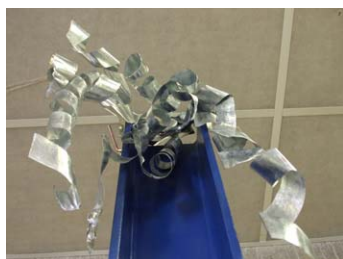
Projet Paysages d'atelier