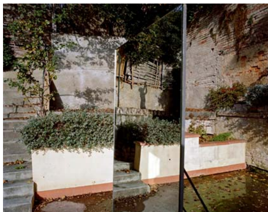
Surfaces de contact, 2009

Dans la série de photographies ainsi réalisée, l'artiste oppose – ou appose – au réel de ces paysages gersois « le mirage du miroir, dans lequel le passant croise, le temps d'un arrêt, son double, son reflet éphémère. Mais dans le jeu des échelles que lui tend le paysage, l'homme finit par endosser l'habit d'un figurant miniature, au point de confondre reflet et réalité... »