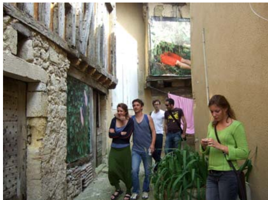
Cheminevements 2007 à Miradoux