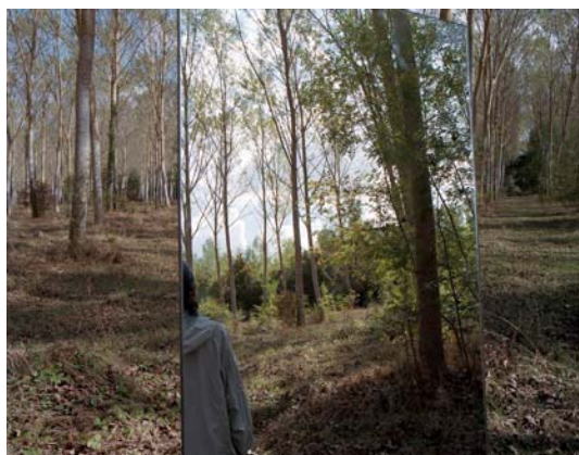
Surfaces de contact, 2009