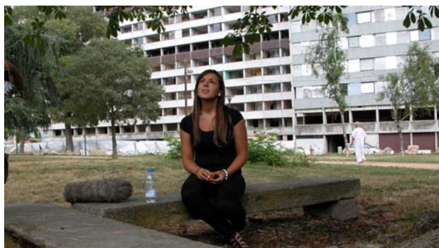
France, détours, photo de tournage