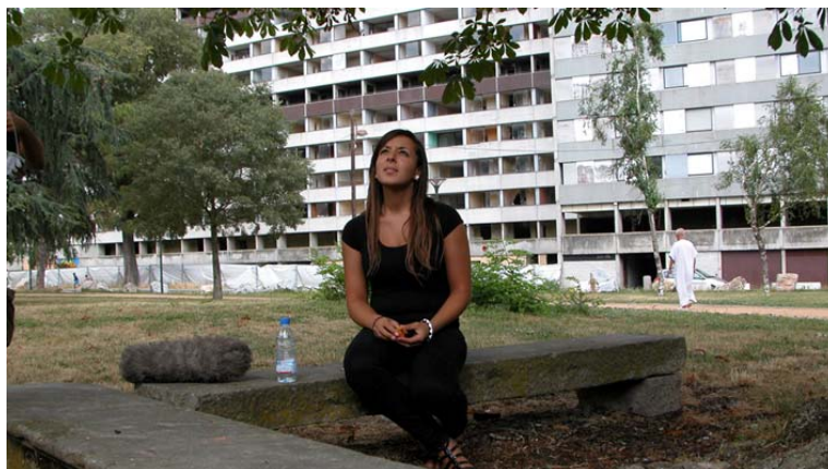
France, détours, photo de tournage

Créée pour le Printemps de Septembre en 2009, France, détours , est une transposition de la série télé France, tour détour, deux enfants , réalisée par Jean-Luc Godard et Anne-Marie Miéville en 1978. Entre réel et fiction, ce premier épisode tourné essentiellement dans le quartier du Mirail repose sur une série d'entretiens menés auprès d'adolescents qui y résident.