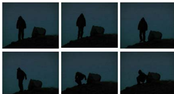
Rien ne dit