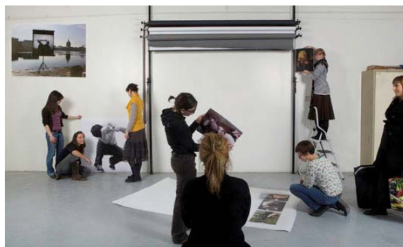
Accrochage Picturediting, école des Beaux-arts, février 2010

→ Retrouvez une sélection d'images haute définition et libres de droit sur notre espace presse : www.centre-photo-lecture.fr , utilisateur : espace presse, mot de passe : docspl