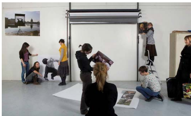
Accrochage Picturediting , école des Beaux-arts, février 2010

On retrouve ce procédé au cœur de nombreuses pratiques artistiques contemporaines : dans l'édition de livres d'artistes, la présentation de diaporamas mais aussi dans les dispositifs d'exposition.