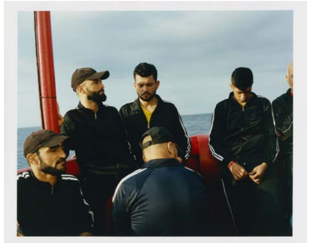
Charles Thiéfaine © Charles Thiéfaine