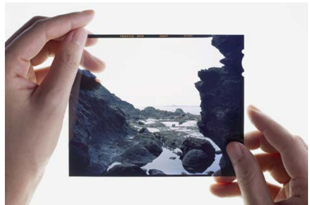
Lucas Leglise Siestes © Lucas Leglise Vue de la grotte de Saint-Énogat © Lucas Leglise