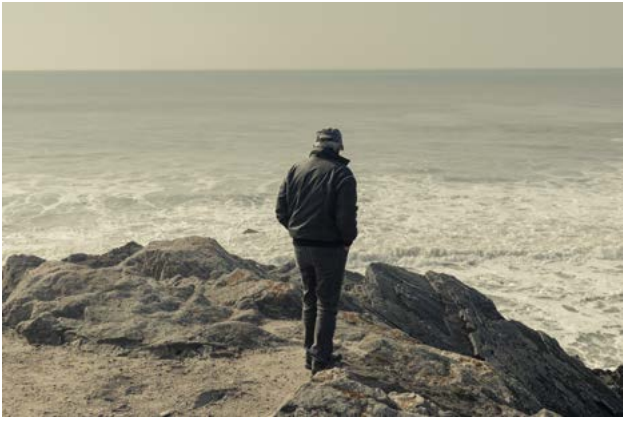
Léonie Pondevie Un point bleu pâle © Léonie Pondevie