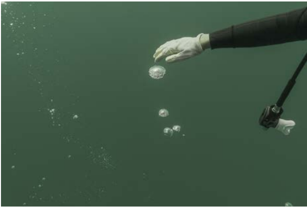
Jonàs Forchini Un apprentissage du trouble