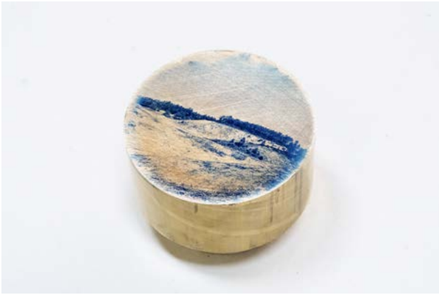
Coline Jourdan Sublimation , 2022